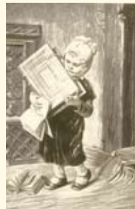
Illustration Hermann Kaubach. Mit freundlicher Genehmigung der Fa. WiFa Druck.

Allen interessierten Kindern soll die Teilnahme an der Kinderbuchwoche möglich sein. Bei finanziellen Hürden finden wir eine Lösung. Nehmen Sie bitte Kontakt mit uns auf Telefon 0981 97774590.